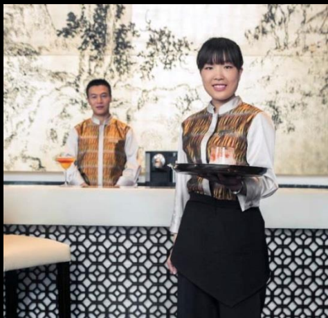
SENSE OF WELCOME 热情好客之感