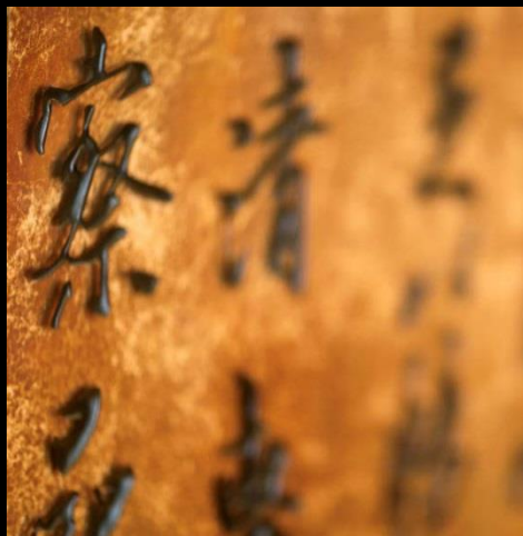
SENSE OF DISCOVERY 文化探索之感