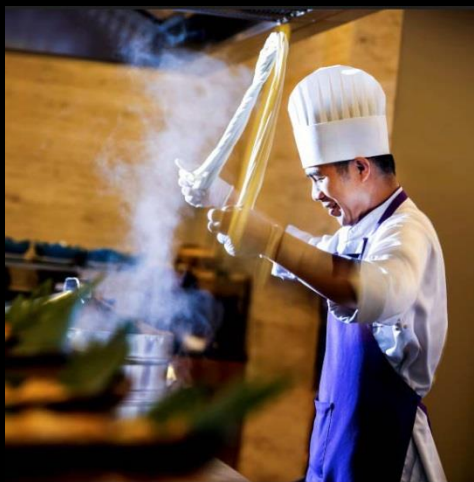
SENSE OF TASTE 丰富味蕾之感