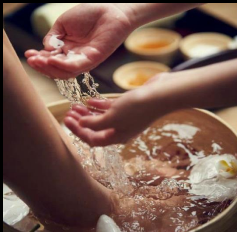
SENSE OF WELLNESS 身心平衡之感