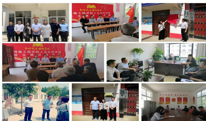
图 3 河南工程学院法律咨询服务站挂牌

我院的校企合作高度重视社会效应。在太康县城郊乡建立的“河南工程学院法律咨询服务站”，无偿进行一对一法律咨询和法律援助。2019 年 6 月，我院组织对太康县司法局干部进行培训，后续还将对 23 个乡镇司法所干部进行培训，共计 120 人。（见图 3）